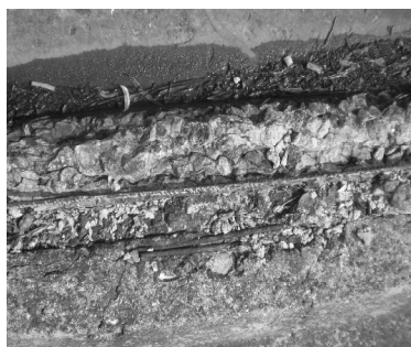
Рис. 2. Характерні пошкодження плит

Пошкодження плит у вигляді викришування бетону з подальшим оголенням арматури нижнього ребра плити є характерним типом (рис. 2). Це пояснюється комплексним впливом природних факторів, основні з яких це різні температурні деформації арматури та бетону, а також втрата бетону морозостійкості внаслідок циклічного замерзання води атмосферних опадів, яка накопичується біля нижнього ребра плити. Плити, які знаходяться під мостами, захищені від атмосферних опадів, для них таке пошкодження не є характерним.