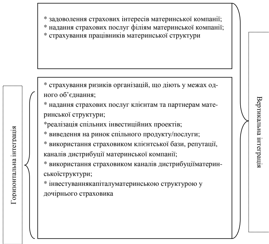
Рис. 2. Цілі взаємодії інтегрованого страховика та материнської компанії

Нині на страховому ринку публічно діють п'ять українських страхових груп. Страхова група “ДАСК”, “VSK InsuranceGroup”, “АСКА”, “ABC МИР” та “Теком”. Кожна з цих груп успішно працює, займаючи свій сегмент ринку. Страхові групи “ДАСК” та “АСКА” є потужними всеукраїнськими компаніями, натомість три інші мають регіональне спрямування.