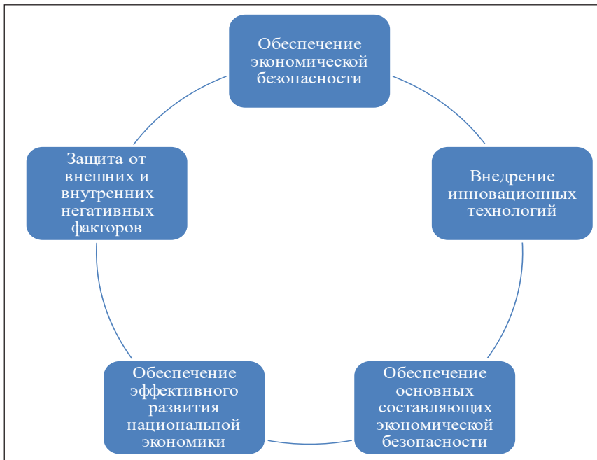
Рис. 3. Основные задачи, которые выполняет государство для обеспечения экономической безопасности