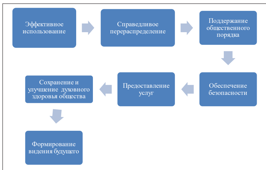
Рис. 2. Основные задачи системы государственного управления

– постановления и распоряжения Кабинета Министров Украины;