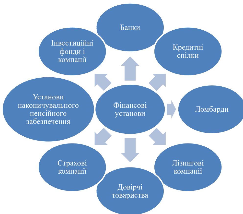
Рис. 1. Фін нсові уст нови, які функціонують в Укр іні

З рис. 1 ми б чимо, що до фін нсових уст нов, які функціонують в Укр іні н леж ть: