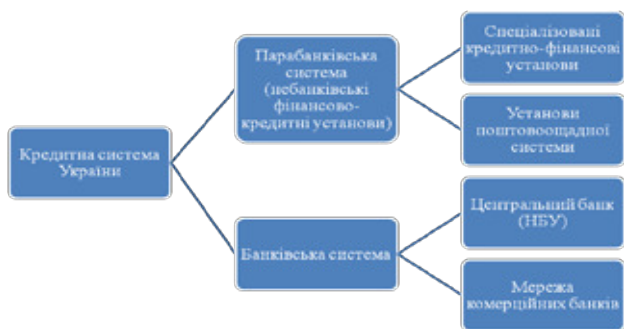
Рис. 1. Місце небанківських фінансово-кредитних установ у загальній кредитній системі України

З рис. 1 ми бачимо, що небанківські фінансово-кредитні установи належать до другого рівня кредитної системи України, їх також називають парабанками, вони виконують деякі функції банків. Виникнення фінансового посередництва в Україні зумовлено розвитком ринкової економіки. Об'єктивно необхідним явищем для ефективного функціонування ринкової економіки є небанківські фінансові посередники. Вони у свою чергу беруть на себе надання суб'єктам господарювання специфічних послуг, виконання чи надання яких є для банків не вигідним чи законодавчо забороненим, саме це надає велику перевагу даним установам, оскільки зумовлює їхню конкуренцію з банками у боротьбі за вільні грошові капітали.