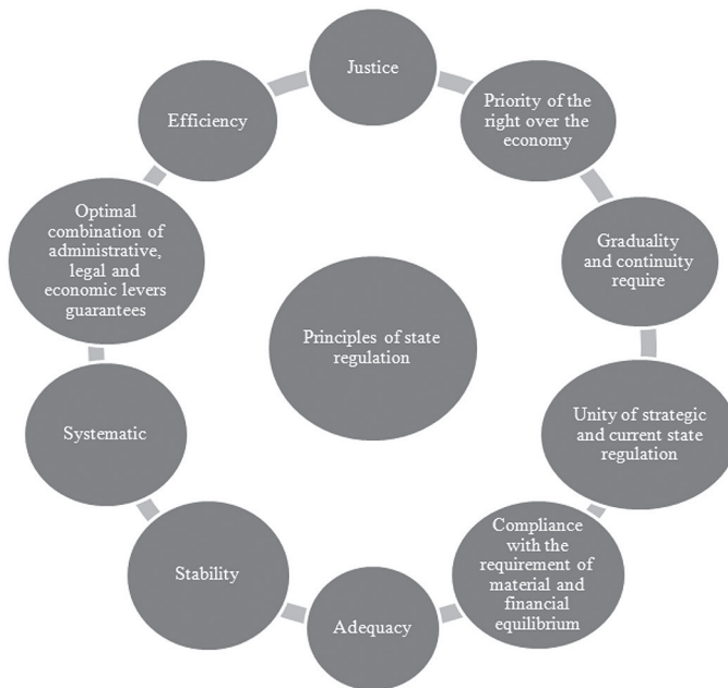
Fig. 1. Principles of state regulation 1