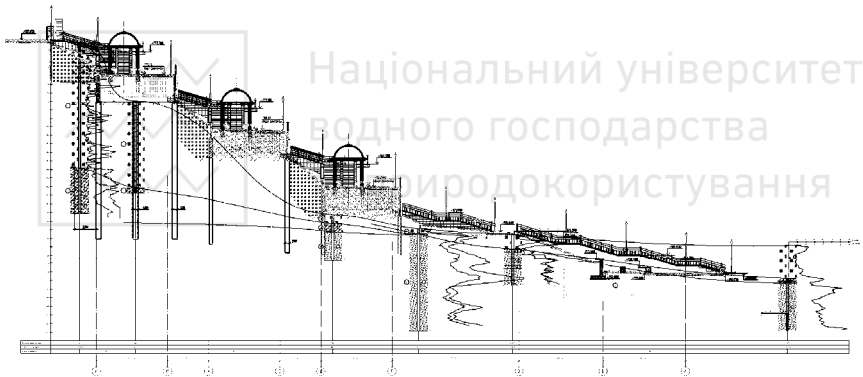
Рис. 3. Инженерно-геологический разрез с нанесенными контурами сооружения лестничного спуска по его длине

Полевые испытания при строительстве объекта. Для контроля расчетных предпосылок, обеспечения безопасности производства строительно-монтажных работ и эксплуатации самого лестничного спуска было предусмотрено следующие элементы геотехнического мониторинга: опытное испытание буронабивных свай вертикальной вдавливающей нагрузкой и геодезический мониторинг за горизонтальными и вертикальными перемещениями монолитных подпорных стен.