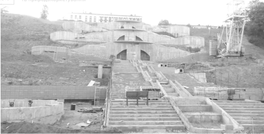
Рис. 4. Общий вид склона после устройства основных бетонных работ

Національний університет водного господарства та природокористування