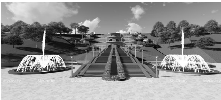
Рис. 1. Архитектурная концепция проектируемого усиления склона

промежуточных площадках (отм. +172.500, 165.900, 159.300) по центральной оси лестницы под каскадным фонтаном устраиваются гrotы для отдыха.