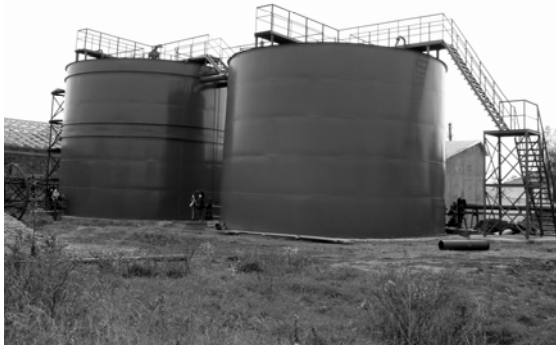
Рис. 1. Очисні споруди Тарасовецької птахофабрики