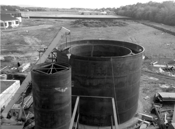
Рис. 3. Монтаж очисних споруд забійного цеху ТОВ «Драчинецьке-1»

Вони влаштовуються у вигляді циліндричних і циліндроконічних металевих резервуарів, розміщених вище рівня землі. Це дозволяє значно скоротити терміни будівництва у порівнянні з варіантом зведення очисних споруд із залізобетону, підвищити якість металоконструкцій, оскільки зварювання металевих аркушів у рулони здійснюється на заводах в автоматичному чи напівавтоматичному режимах із застосуванням сучасних методів контролю якості зварних швів. Сучасні полімерні покриття дозволяють запобігти корозії металу. Будівництво ємностей вище рівня землі дозволяє скоротити до мінімуму об'єми земляних робіт, площі котлованів, оскільки їх основою є піщана подушка. У сейсмічних районах і при просідаючих ґрунтах влаштовуються кільцеві або фундаменти з паль.