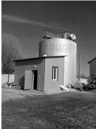
Рис. 2. Очисні споруди підприємства «Брусилівські ковбаси»