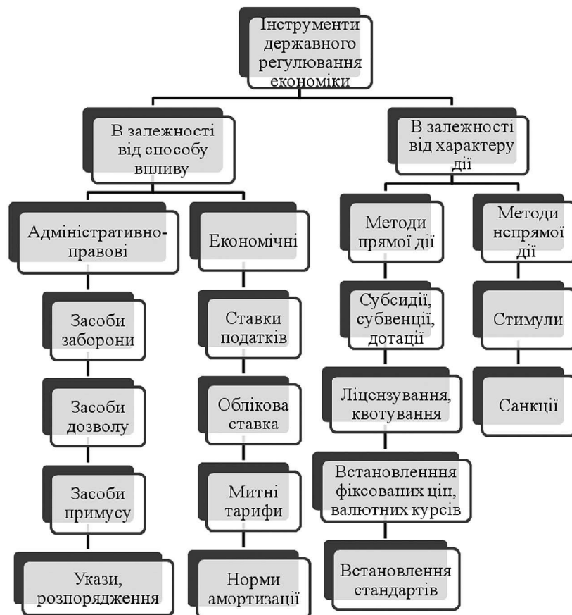
Рис. 2. Інструменти державного регулювання економіки

З рисунка 2 ми можемо побачити, що інструменти державного регулювання економіки поділяються на: