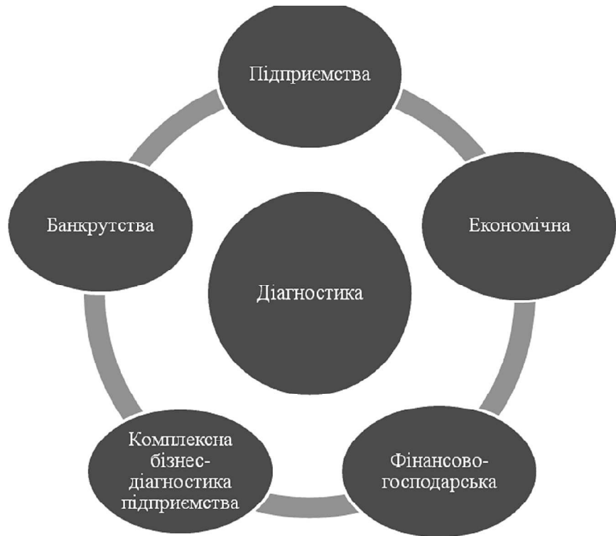
Рис. 1. Види діагностики

Крім того, в сучасних економічних умовах надзвичайно актуальною є своєчасна, повна та об'єктивна діагностика економічної безпеки держави інструментами державного управління. Це дозволяє оперативно виявляти загрози і небезпеки та використовувати адекватний інструментарій мінімізації їх впливу, планувати та реалізовувати механізм захисту держави від небезпек і загроз та, в свою чергу, оптимізувати і систематизувати роботу всієї національної економіки.