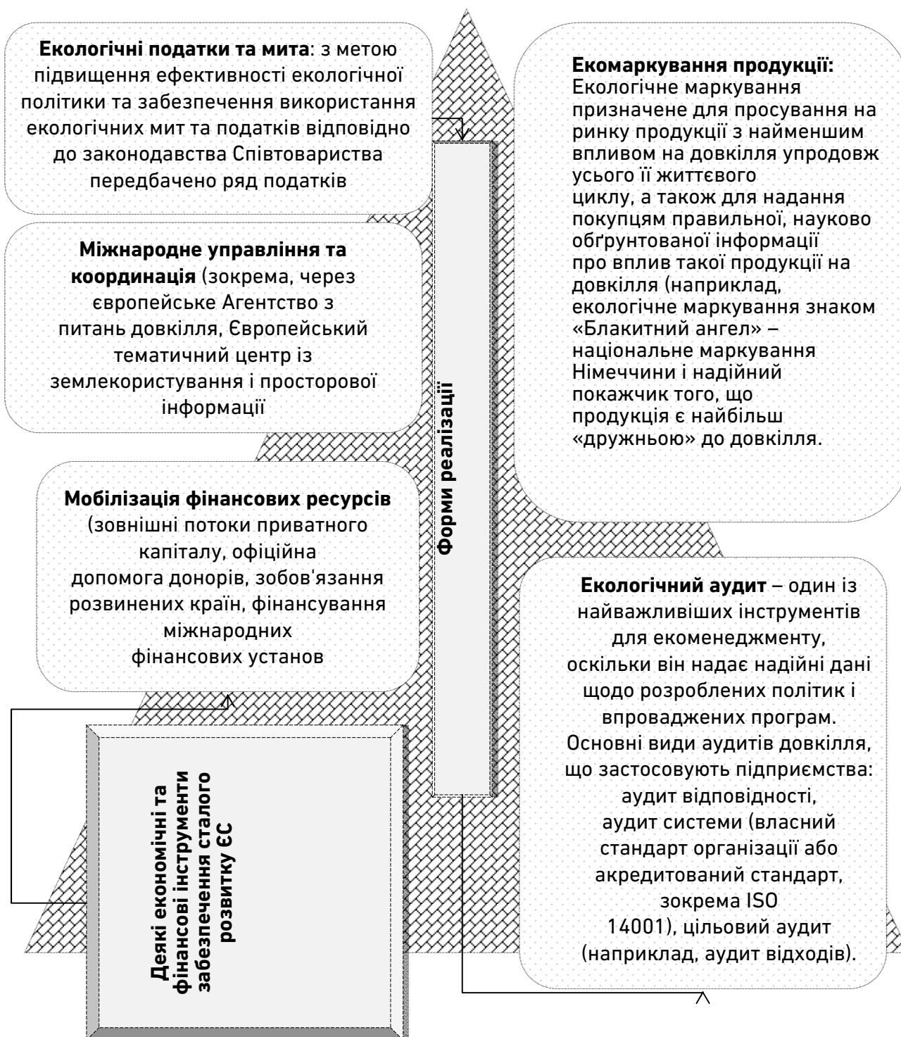
Рис. 2. Деякі економічні та фінансові інструменти забезпечення екологічної складової сталого розвитку ЄС [8; 9]