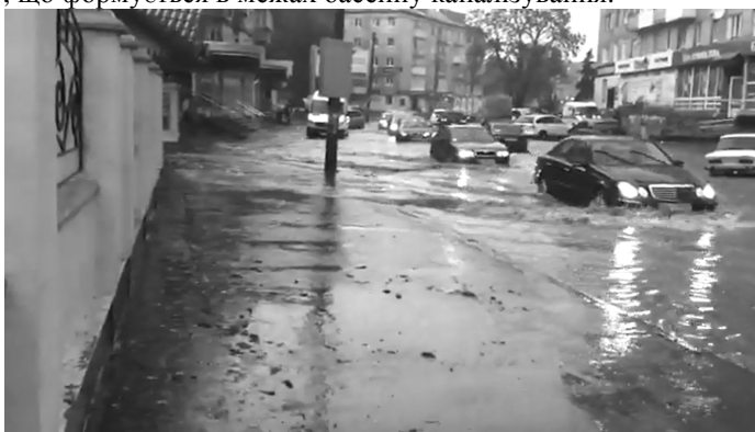
Рис. 1. Затоплення центральної вулиці м. Рівне дощовими водами (13.09.2013 р.)

Влаштовані в містах України відповідно до чинних нормативів [1, 2] системи дощової каналізації не забезпечують передбаченого про-ектами відведення атмосферних вод з міських територій (рис. 1). Осо-бливо це стає помітним в останні роки у зв'язку із глобальними зміна-ми клімату на Землі. Часто має місце невідповідність фактичних хара-ктеристик існуючих споруд дощової каналізації параметрам дощового стоку, що формується в межах басейну каналізування.