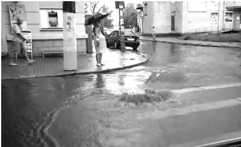
Рис. 3. Затоплення міської вулиці через люк колодезя дощової мережі (м. Житомир, 12.09.2013 р.)

Усунення зазначених недоліків в організації відведення дощових вод з територій населених пунктів вимагає різних за складністю та об'ємами видів робіт. При цьому будь-який спосіб буде ефективним тільки за умови належної експлуатації споруд дощової каналізації.