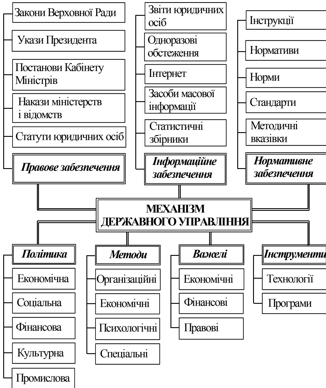
Рис. 2. Модель механізму державного управління за О. Федорчак [6, с. 179]

Для більш компактного зображення моделі механізму державного управління в складовій «Правове забезпечення» об'єднаємо елементи «Укази Президента України», «Постанови Кабінету Міністрів України», «Накази міністерств і відомств» в один – «Підзаконні нормативно-правові акти». Словосполучення «Закони Верховної Ради» з правової точки зору вважаємо некоректним. Відповідно до статей 91 та 92 Конституції України, правильно писати «Закони України, прийняті Верховною Радою України» або ж писати просте словосполучення «Закони