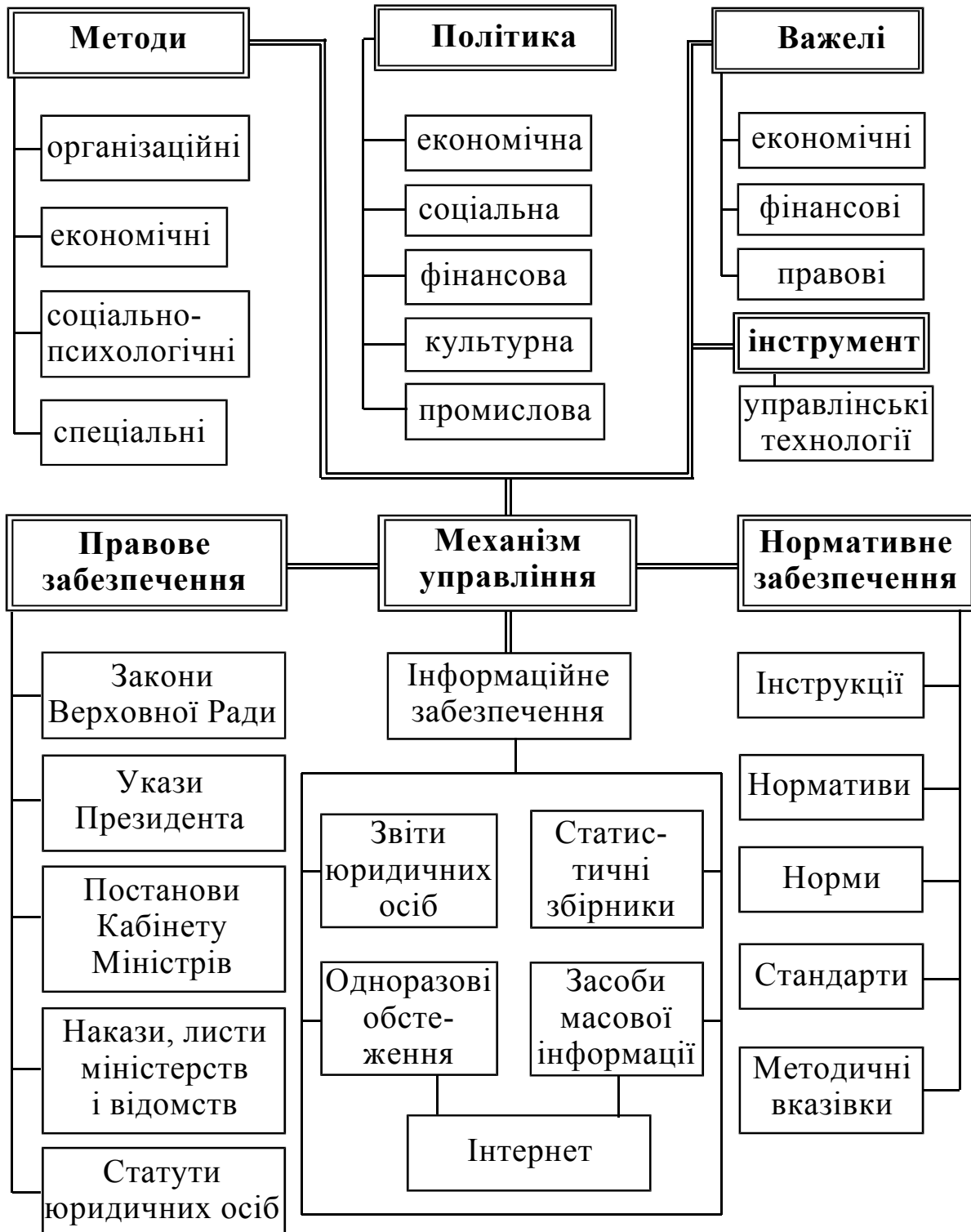
Рис. 1. Модель механізму державного управління за Р. Рудніцькою, О. Сидорчук, О. Стельмахом [3, с. 19]

поведінки, різного роду положення, інструкції (в тому числі посадові) та ін.