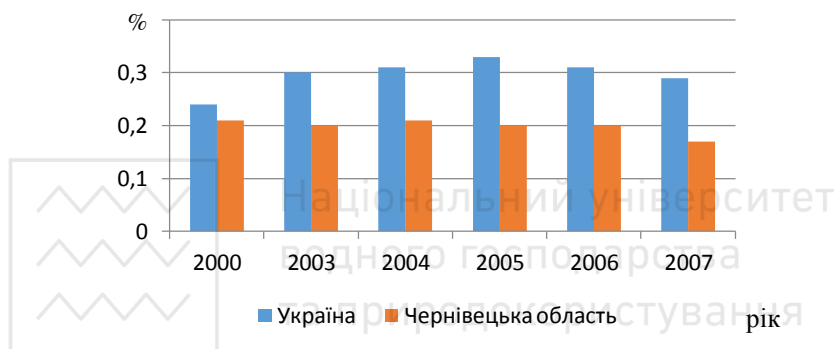
Рис. 2.1 - Коефіцієнт використання місткості готелів в Чернівецькій області та в Україні в цілому

Таблиці та рисунки допоміжного характеру та ті, що займають обсяг всієї сторінки, доцільно розміщувати у додатках з обов'язковим посиланням на них у тексті курсової роботи.