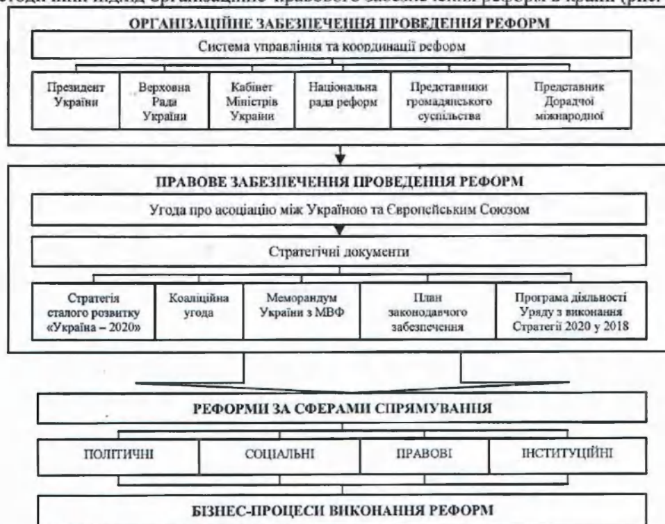
Рис. 3. Методичний підхід організаційно-правового забезпечення реформ в країні

Проведені дослідження дали можливість запропонувати авторський методичний підхід організаційно-правового забезпечення реформ в країні (рис. 3).