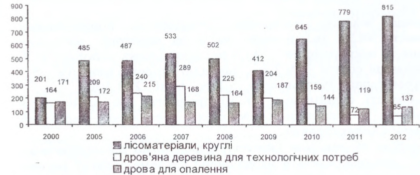
Рис. 2. Заготівля ліквідної деревини за категоріями технічної придатності у Волинській області

Зелені насадження мають меліоративне, водоохоронне і вітрозахисне значення. Зменшуючи силу вітру, завдяки величезній фільтрувальній поверхні листяного покриву, дерева сприяють осіданню пилових частинок. Повітря на озелених вулицях в 4 рази чистіше, ніж на ділянках, які не мають зеленого покриву.