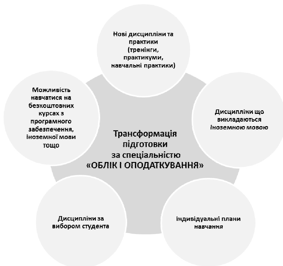
Рис. 2. Основні напрями трансформації підготовки здобувача за спеціальністю «Облік і оподаткування» у сучасному середовищі

Висновки. Таким чином, найсуттєвішими трендами у сучасній освіті, і зокрема професійній бухгалтерській, є: дистанційне навчання, широка співпраця університетів і бізнесу, білінгвальність. Вирішення описаних проблем можливе завдяки впровадженню наступних концепцій: гармонійного поєднання навчання з роботою; запровадження гнучких систем навчання.