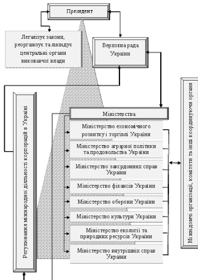
Рис. 1. Система регулювання міжнародної діяльності корпорацій в Україні

управління процесами на основі нових механізмів регулювання міжнародної діяльності корпорацій відрізняється динамізмом, розширенням і ускладненням інструментарію, та високою мобільністю територіальних конфігурацій. Різні виміри державного регулювання міжнародної економічної діяльності корпорацій – багатосторонній, регіональний, міжрегіональний, інтеграційний, двосторонній – все більш тісно взаємодіють і доповнюють один одного, створюючи сприятливі можливості для ефективного забезпечення національних інтересів. В таких умовах визначення стану функціонування та результативність державних механізмів регулювання міжнародної діяльності корпорацій в Україні на основі компаративного аналізу з іншими країнами має значний інтерес та практичну цінність. Це необхідно для вирішення проблеми розробки результативних заходів щодо удосконалення як законотворчих ініціатив в державотворенні, так і для розробки практичних рекомендацій (рис. 1).