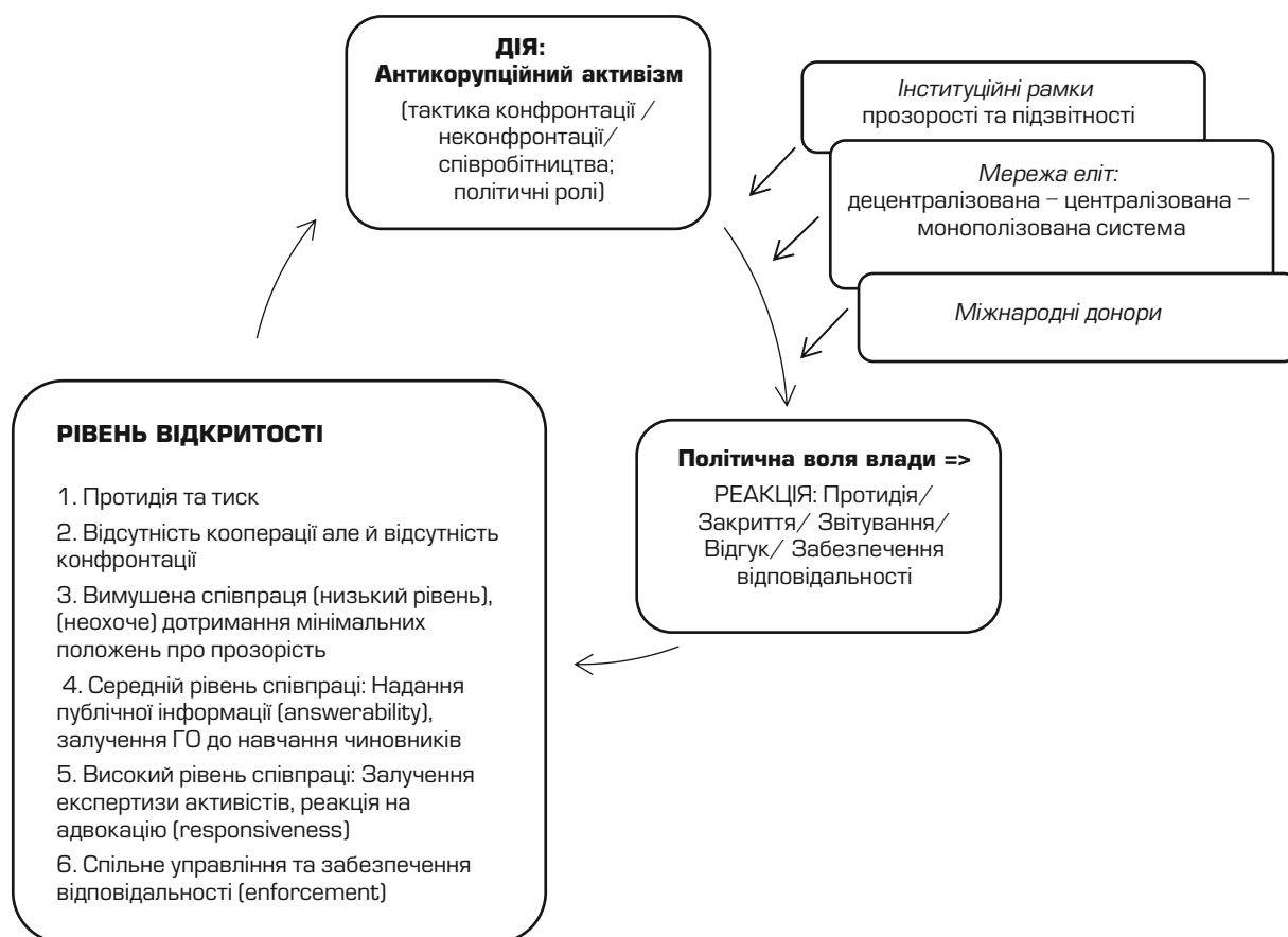
Рисунок 1: Контекстуальні фактори, які зумовлюють успішність антикорупційного активізму

Уся література з питань прозорості та підзвітності (T&A Transparency & Accountability) розглядає обидва явища як основні передумови успішної антикорупційної діяльності. Припущення про позитивний вплив прозорості та підзвітності на протидію корупції випливає з підходу принципала-агента (Klitgaard 1988; Rose-Ackerman 1978), який відображає ієрархічні відносини між громадянами – «керівниками» та «агентами» – державними службовцями. Відповідно до теорії принципала-агента, керівник передає агенту шляхом прямих виборів або непрямих призначень повноваження на надання державних послуг та адміністрування державних ресурсів. Агенти будуть залучені до корупції, якщо відповідно до їх розрахунків вигоди від корупційних дій перевищують витрати (наприклад, покарання). Інформаційна асиметрія є головною передумовою корупції, оскільки керівник не в змозі постійно контролювати дії агента, і тому агент має певну свободу та можливість переслідувати власні інтереси (IIER 2019). Як наслідок, прозорість є найважливішим інструментом уникнення асиметрії інформації, зменшення дискреції, розкриття або