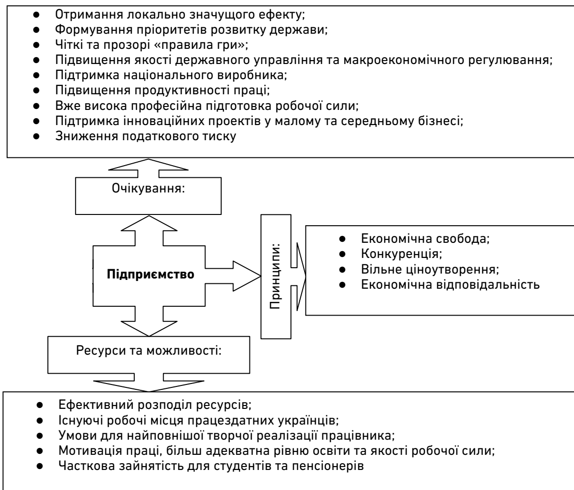
Рис. 1. Принципи побудови соціально орієнтованих підприємств

Концепцію соціально відповідальної поведінки підприємств давно переведено зі складу теоретичних обґрунтувань до її активного впровадження, що здійснюється представниками бізнес-середовищ внаслідок розвитку таких тенденцій, як: зниження ролі держави в соціальній сфері; збільшення вимогливості з боку споживачів до діяльності підприємств; розподіл відповідальності між партнерами і підвищені вимоги, у тому числі соціальні, з боку інвесторів. Соціально відповідальна поведінка не вимагає радикального розриву зі звичайними формами корпоративної діяльності. Зважаючи на викладене вище, у дисертації визначено основні принципи побудови соціально орієнтованих підприємств (рис. 1).