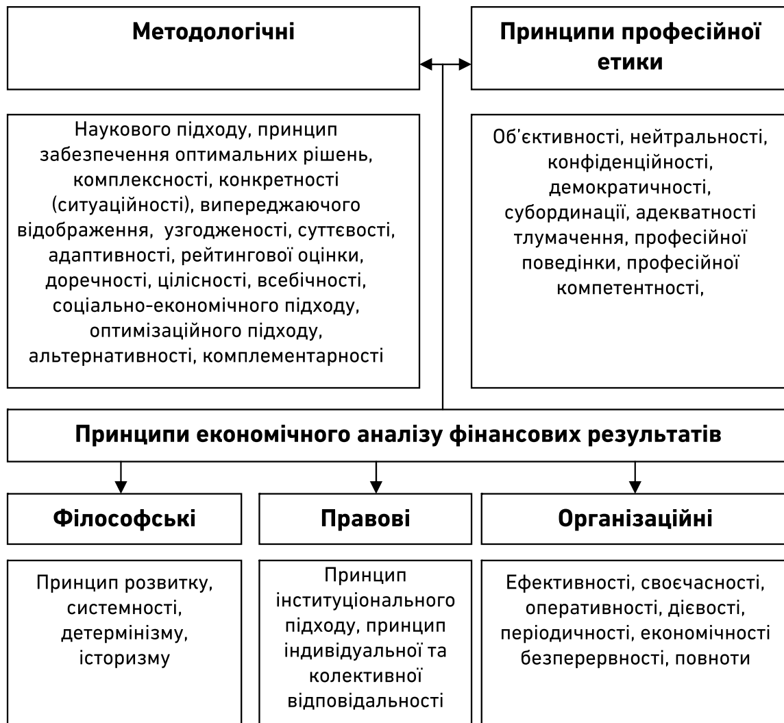
Рисунок. Принципи економічного аналізу фінансових результатів*