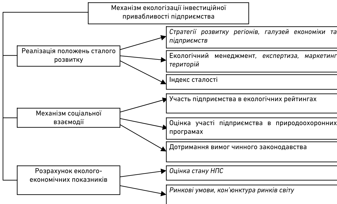
Рис. 2. Механізми формування інвестиційної привабливості сільськогосподарських підприємств та водогосподарських організацій з урахуванням екологічного чинника [8]*