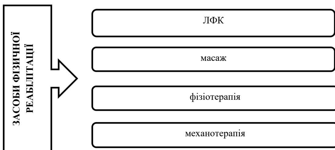
Рис. 1. Засоби фізичної реабілітації дітей з синдромом Дауна

Застосування засобів фізичної реабілітації дітей з синдромом Дауна (рис. 1) передбачають удосконалення наявних та розвиток нових умінь, навичок рухових функцій; готовність до варіативного застосування набутих умінь, навичок, формування альтернативного переміщення при порушенні моторних функцій; збереження наявного та зміцнення загального здоров'я дитини; мотивація дитини до активної навчальної та рухової діяльності [14].