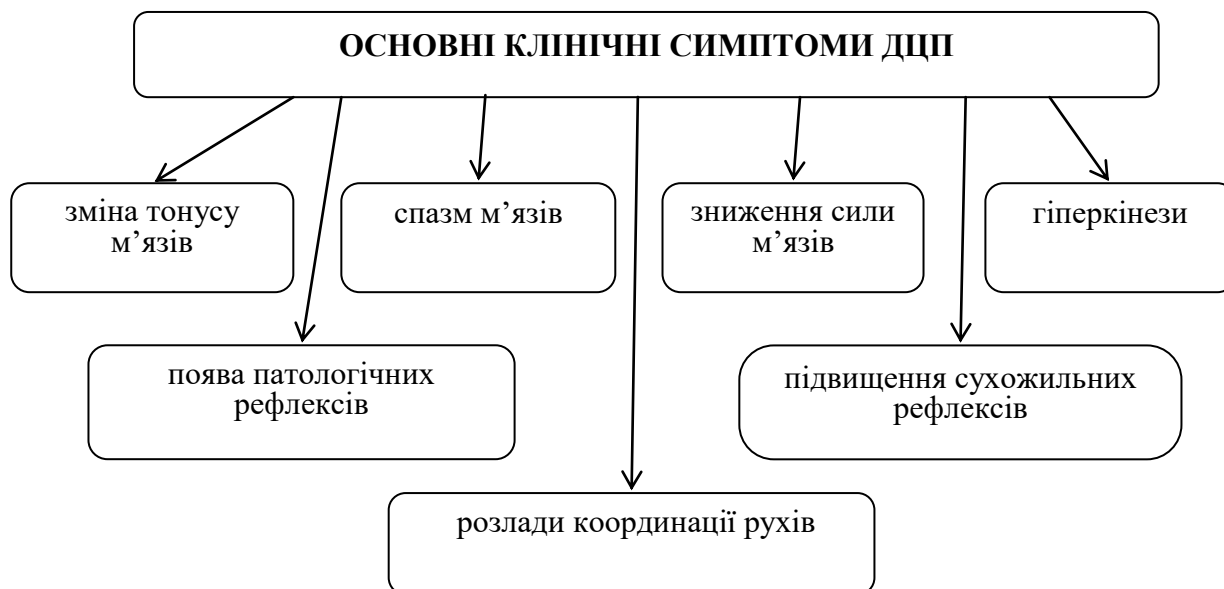
Рис. 1. Основні клінічні симптоми ДЦП

Проблема розвитку дітей із ДЦП була піддана багатосторонньому дослідженню, що відбито у роботах різних авторів [1].