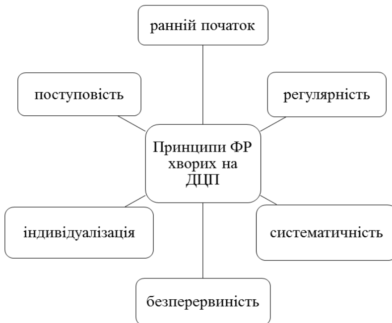
Рис. 3. Принципи фізичної реабілітації хворих на ДЦП

Варто зауважити, що при відновленні рухових функцій дітей, хворих на церебральний параліч, фахівці рекомендують дотримуватися певних принципів (рис. 3.)