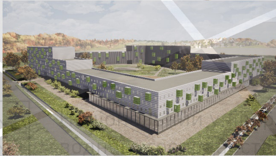
Фасад 1 20