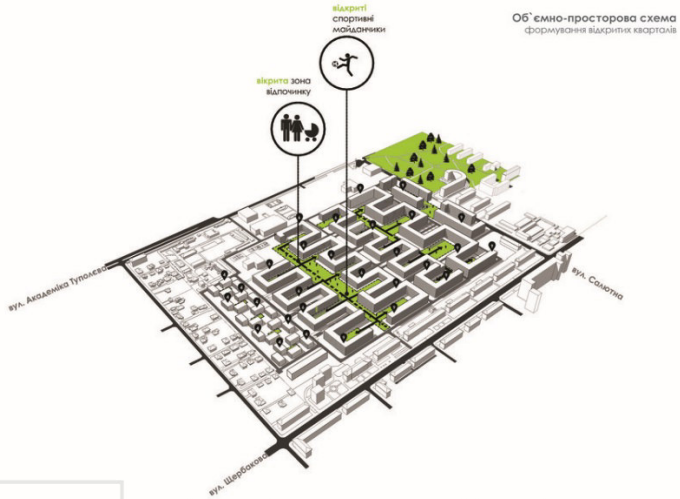
Об'ємно-просторова схема формування відкритих кварталів

Національний університет водного господарства та природокористування