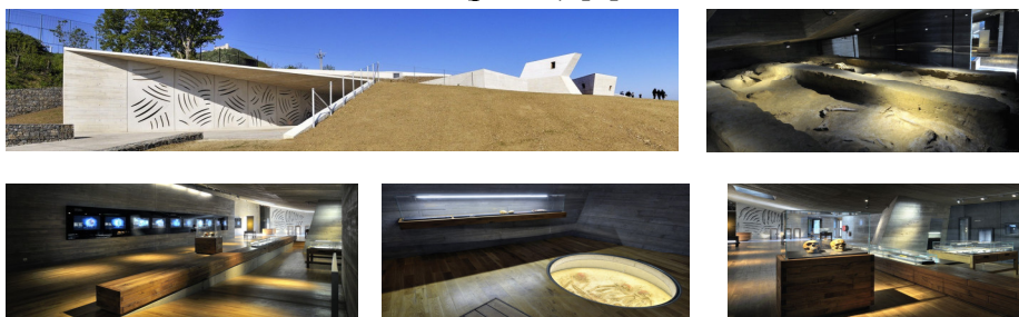
Рис. 1. Археологічний парк Pavlov [3]

Археологічний парк Pavlov. Знаходиться в Чехії на місці розкопок стародавнього поселення. Архітектурна фірма Radko Květ розробила для нього проект музею площею більше 500 квадратних метрів, який включає в себе сучасні аудіовізуальні технології з традиційними виставковими експозиціями (рис. 1) [3].