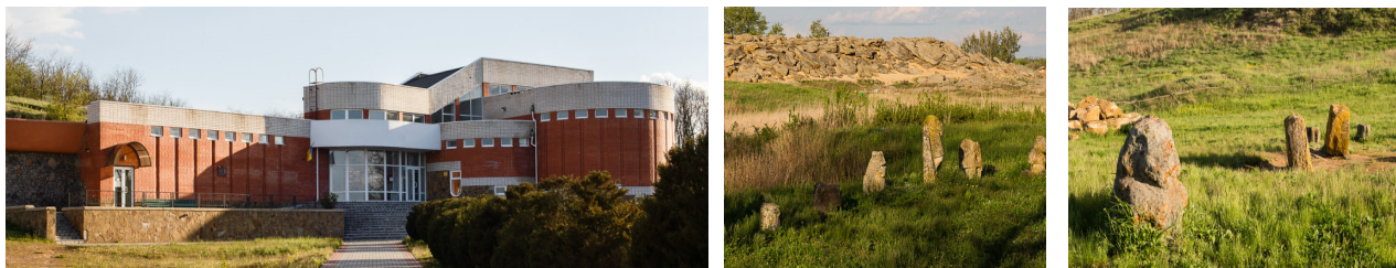
Рис. 3. Історико-археологічний заповідник «Кам'яна могила» [6]

Історико-археологічний заповідник «Кам'яна могила». Заповідник, розташований поблизу Мелітополя в смт Мирне у Запорізькій області над річкою Молочною. Пагорб, що тисячоліттями слугував людям вівтарем для відправлення язичницьких обрядів, містить декілька тисяч унікальних стародавніх наскельних зображень – петрогліфів. На території заповідника розміщений музейний комплекс, в якому представлені унікальні експонати, що відображають побут та культуру первісних людей (рис. 3) [5].