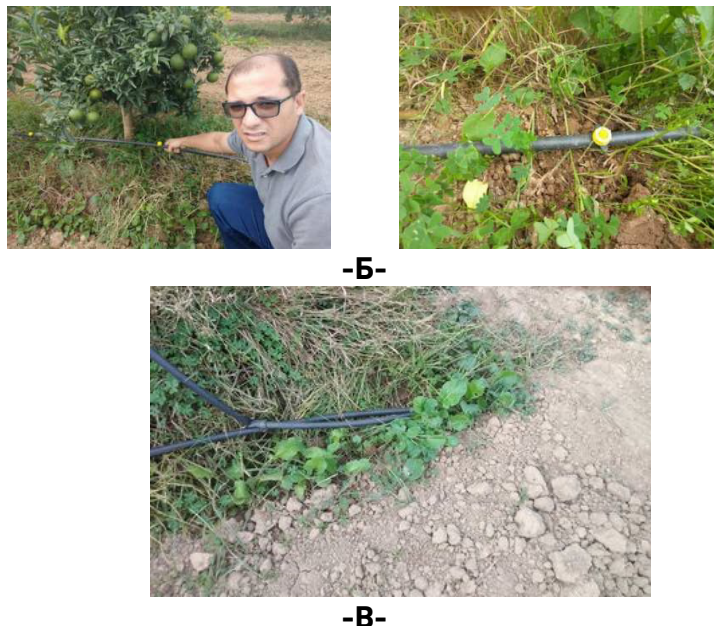
Рис. 4. Проведення натурних досліджень на ділянці краплинного зрошення «exploitation agricole individuelle (EAI) N18 Oued Elalleug, W. Blida, Algérie»: А – краплинні водовипуски «irritec» жорсткого типу, вхідна та вихідна їх частини; Б – краплинні водовипуски «irritec» жорсткого типу, які з'єднані з поливним трубопроводом ПТ; В – заглушка для промивання

В результаті обробки дослідів встановлено, що витратні характеристики дослідних крапельниць співпадають з рекомендованими [4; 5] тим самим підтверджуючи гіпотезу про відповідність теоретичного та експериментального законів розподілу. Для характеристики рівномірності поливу можна використовувати коефіцієнт технологічної рівномірності поливу k_T [4].