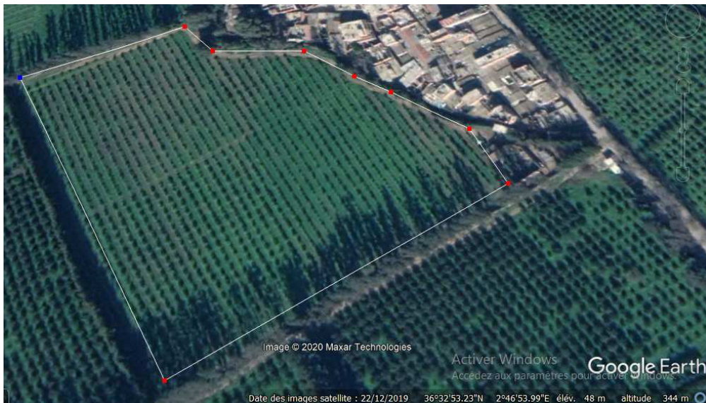
Рис .1. Супутниковий знімок дослідної ділянки «exploitation agricole individuelle (EAI) N18 Oued Elalleug, W. Blida, Algérie» за допомогою GOOGLE EARTH

Максимальний рівень опадів (рис. 3) [3] припадає на травень 2020 р. і сягає 25 мм, найменше опадів спостерігалось в липні – 2 мм.