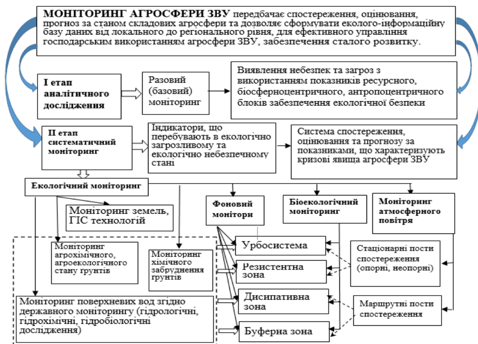
Рис. 2. Блок-схема системи екологічного моніторингу агросфери ЗВУ

Виходячи з цього, комплексна система моніторингу (рис. 2) охоплює всі складові навколишнього середовища агросфери ЗВУ, котрі підлягають впливу сільськогосподарського виробництва, урбосистеми та організовується на локальному територіальному рівні з диференціацією агросфери на відповідні зони.