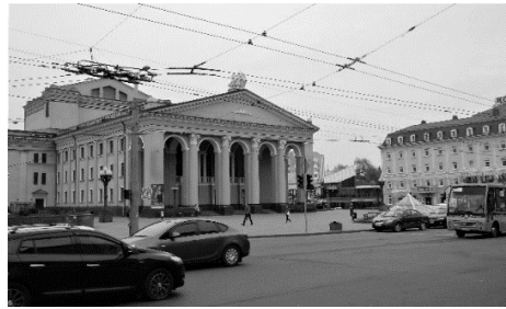
Рис. 3. Ансамбль Театральної площі. Сучасний стан

Однією з перших будівель стилю радянського неоісторизму у м. Рівне став триповерховий житловий будинок з ротондою на даху, що знаходиться за адресою вул. Соборна, 262 (рис. 4), архітектор – Б. Андрєєв. Вікна оздоблені наличниками, що імітують масивну кам'яну кладку. Фасад прикрашений пілястрами. Завершує будівлю декоративний ліхтар у вигляді ротонди з колонами. На першому поверсі розміщувався перший у Рівному центральний гастроном [13, С. 118].