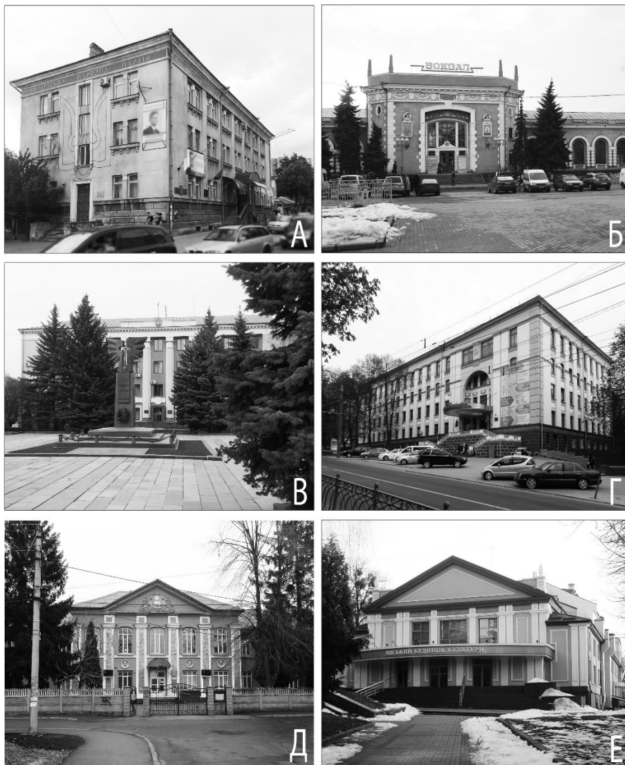
Рис. 5. Громадські будівлі 2-ї пол. 1940–1950-х рр. у м. Рівне: А – Народний дім, вул. Петлюри, 1; Б – Залізничний вокзал, Привокзальна площа, 1; В – Будівля Міської ради, вул. Соборна, 12А; Г – Навч. корпус № 1 НУВГП, вул. Соборна, 11; Д – Будівля ЗОШ № 10, вул. Видумка, 26; Е – Міський будинок культури, вул. Соборна, 3Д

Архітектура громадського призначення зазвичай мала насичені декоруванням фасади незалежно від свого розміщення в містобудівній структурі. Однією з перших громадських будівель у м. Рівне став