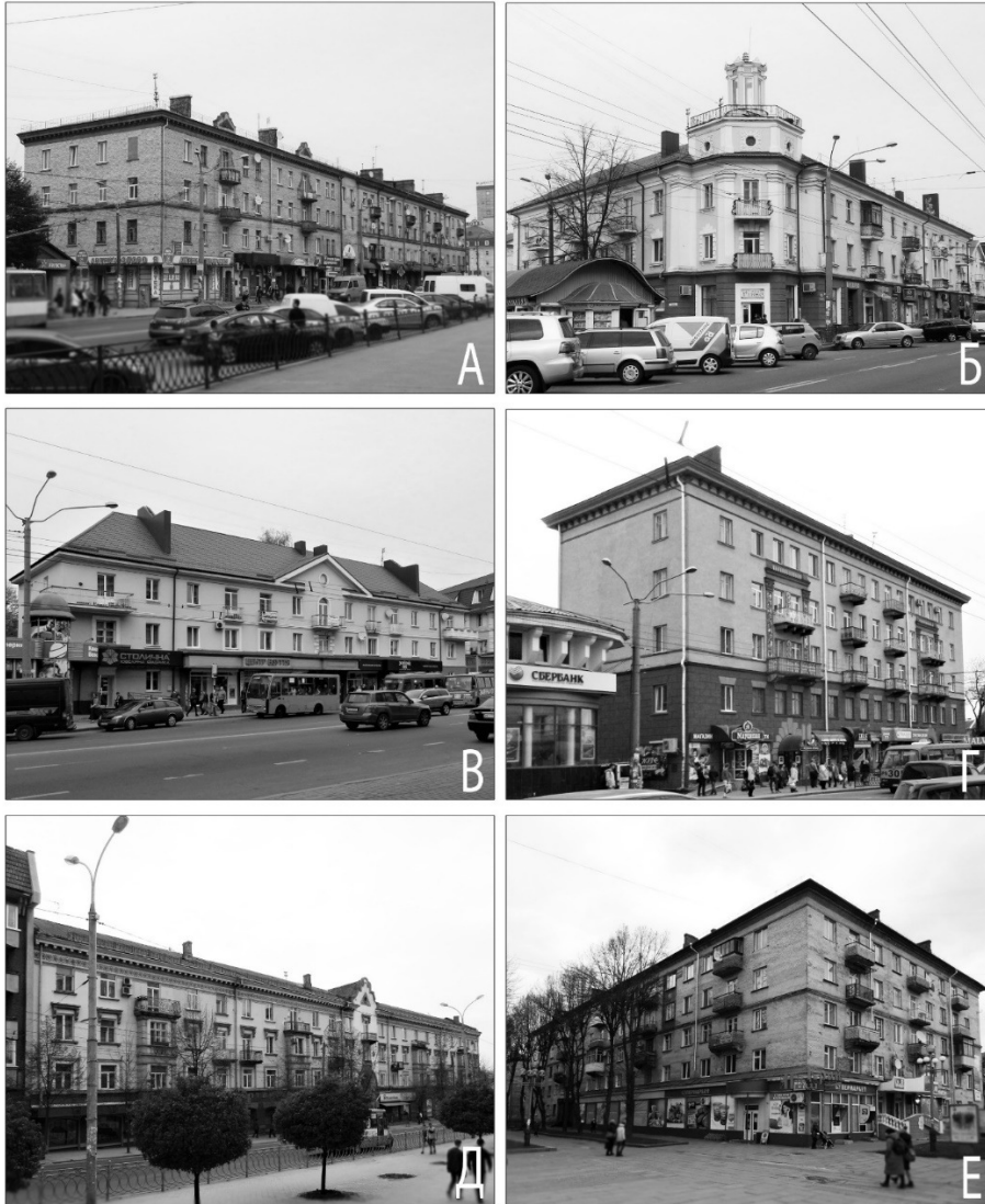
Рис. 4. Житлові будівлі 2-ї пол. 1940–1950-х рр. у м. Рівне: А – вул. Соборна, 156, Б – вул. Соборна, 262, В – вул. Соборна, 260, Г – вул. Соборна, 135, Д – вул. Соборна, 15, Е – Проспект Миру, 2