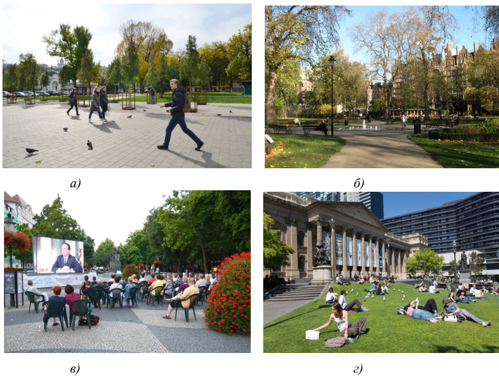
Рис. 1. Зразки облаштування громадського простору: а) сквер Контрактової площі, м. Київ [2]; б) Рассел-сквер, м. Лондон [7]; в) площа Гвездослава, м. Братислава, Словаччина [2]; г) газон перед бібліотекою, Мельбурн, Австралія [6]

Громадський простір – це територія масового перебування людей, де перетинаються різні соціальні, культурні та особистісні процеси. Це місце декларує принципи відкритості та доступності для всіх громадян, незалежно від статі, раси, національності, віку чи їх соціально-економічного рівня (рис. 1). Успішні публічні простори приваблюють людей, в них вирує соціальне життя та відбувається культурний обмін [2].