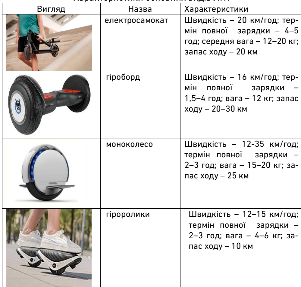
Характеристики основних видів ЛПТ