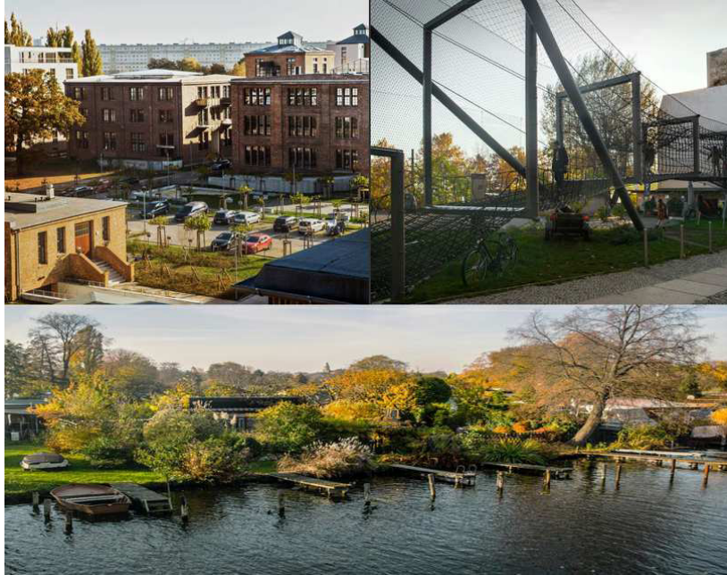
Рис. 5. «Glanzfilm AG» в м. Берлін – Кепенік, Німеччина

гій в Україні став перший інноваційний парк UNIT. City, відкритий у Києві 2017 року на території колишнього Київського мотозаводу. Станом на 2020 рік в інноваційному парку налічувалось 108 компаній-резидентів [11].