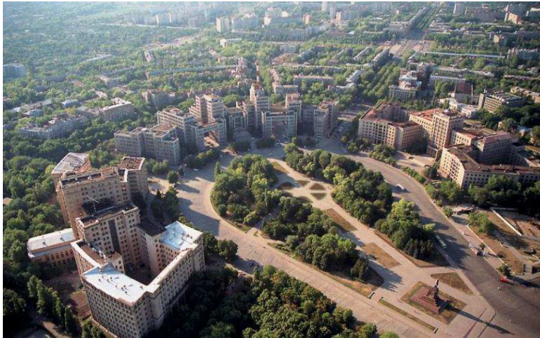
Рис. 1. Приклад «відкритого простору» в м. Харків, Україна

2. Заповнення. Включає: тимчасові архітектурні будівлі і споруди, підпірні стінки, пандуси, сходи, каскади, кіоски, вітрини, лінійні стінки, що перегороджують елементи (парапети, колони), ігрові майданчики, містки, монументи, інформаційні пристрої і установки, вуличні ліхтарі, елементи терасування, зелені масиви [5]. Такі елементи періодично трансформуються.