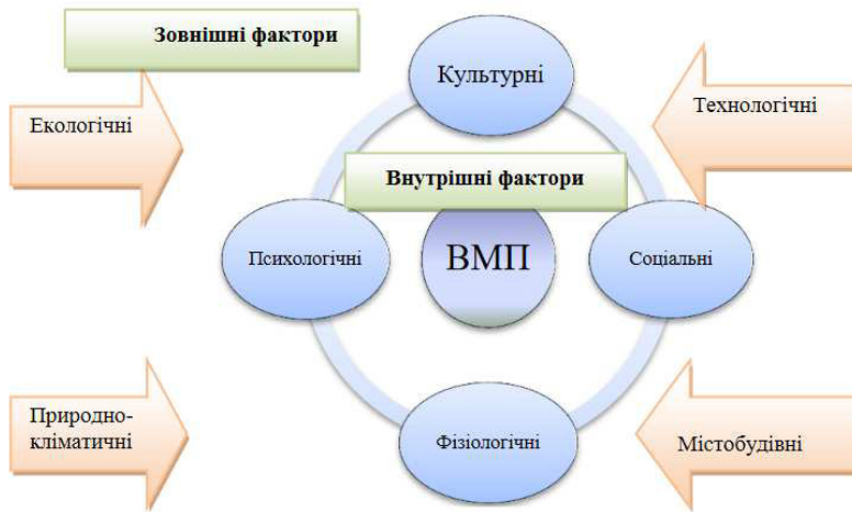
Рис. 4. Критерії формування гуманізаційних міських просторів

дів будівель, естетичне вираження композиційної форми простору, огороження та обладнання.