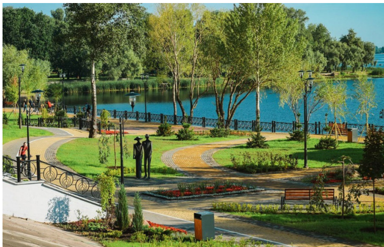
Рис. 2. Парк «Наталка» в м. Київ (Оболонський р-н), Україна