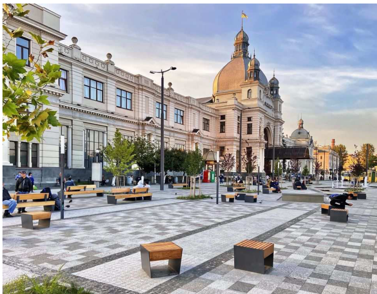
Рис. 3. Приклад «внутрішнього міського простору» в м. Львів, Україна

3. Декорація. Поєднує: елементи реклами, декоративні огорожувальні елементи, декоративні елементи освітлення, фонтани, ландшафтні компоненти – валуни, цінні дерева. Елементи носять тимчасовий, сезонний характер. Існує низка критеріїв, що впливають на формування гуманізаційних міських просторів (рис. 4).