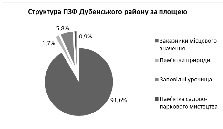
Рис. 2. Структура ПЗФ Дубенського району (за площею)