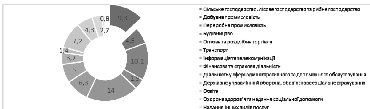
Рис. 1. Частка галузей ВВП України, 2020 р., %

Нині агроринок є одним із найважливіших елементів економіки загалом. Одна з причин – це здатність генерувати значну кількість валового внутрішнього продукту. Відповідно до офіційної статистики у 2020 р. аграрний бізнес забезпечив утворення 9,3% всього ВВП України (рис. 1).