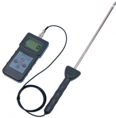
Рис. 2.2. Вологомір PMS710 для вимірювання вологості ґрунту за кондуктометричним методом

2. Тензіометричний метод – ґрунтується на вимірюванні капілярного натягнення ґрунтової води. Для цього використовують тензіометри.