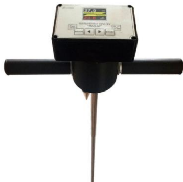
Рис. 6.1. Щільномір ґрунту «ЛАН-М»

дороговартісним аналогам зарубіжних брендів. Щільномір допомагає швидко та точно визначити проблему ущільнення ґрунту на полях, дослідити глибину розташування ділянок ущільнення (відома серед аграріїв «плужна підошва»). Своєчасна діагностика проблеми дозволяє вжити невідкладних заходів та отримати великі врожаї.