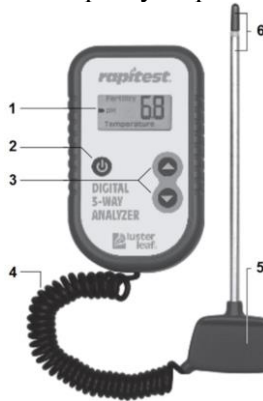
Рис. 5.1. Аналізатора ґрунту DL-1835:

простий і зручний спосіб отримання необхідних вимірювань для забезпечення оптимального росту та розвитку рослин.