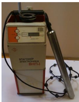
Рис. 2.4. Вологомір ВНП-1 для вимірювання вологості ґрунту за нейтронним методом

3. Нейтронний метод – ґрунтується на вимірюванні ступеню ослаблення інтенсивності гама-променів. При даному методу застосовують вологомір ВНП-1 (рис. 2.4).