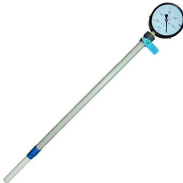
Рис. 2.3. Тензіометр польовий для вимірювання вологості ґрунту за тензіометричним методом

Тензіометри – це тестери, що вимірюють силу поверхневого натягу в прикореневій зоні рослини, значення якого прямо пропорційно відсотковому вмісту води в субстратах (рис. 2.3).