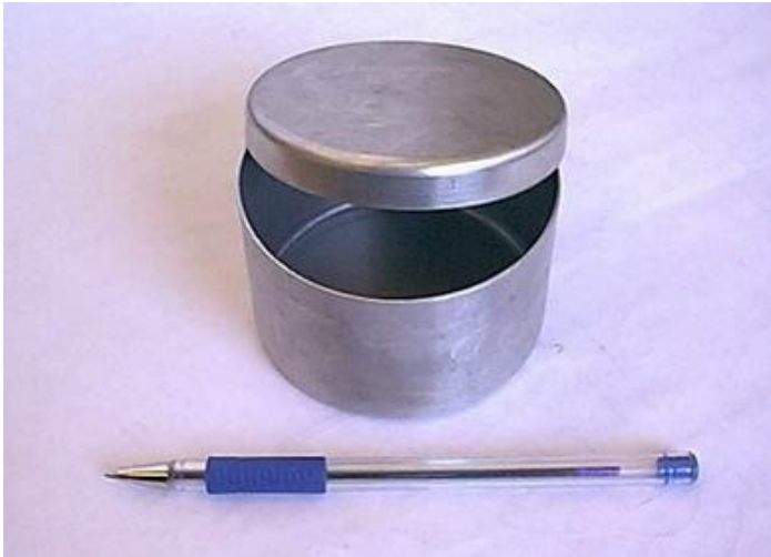
Рис. 2.1. Бюкс для вимірювання вологості ґрунту за термостатно-ваговим методом

- термостійкі стаканчики (бюкси), зазвичай алюмінієві, які попередньо зважують пустими і на кришці пишуть цю початку вагу (рис. 2.1).