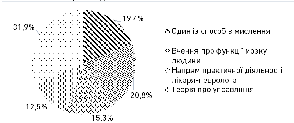
Рис. 2. Динаміка факторів, що характеризують нейроменеджмент як науку і практику управління

Інші відповіді на поставлене запитання, що... «нейроменеджмент – це наука, заснована на...» використанні досягнень нейробиології та інтелекту бізнесмена було оцінено респондентами в межах 18%, на це ж питання відповідь, що... «це наука, заснована на вченні про когнітивне мислення» набрала менше 10%.