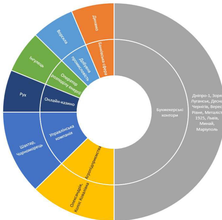
Рис. 3. Бізнес фінансових спонсорів футбольних клубів Української прем'єр-ліги

Спонсорська мережа футбольних клубів є доволі широкою, яка охоплює ще й фінансовий ступінь спонсорства (рис. 3).