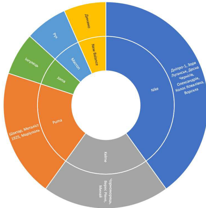
Рис. 2. Бізнес технічних спонсорів футбольних клубів Української Прем'єр-ліги