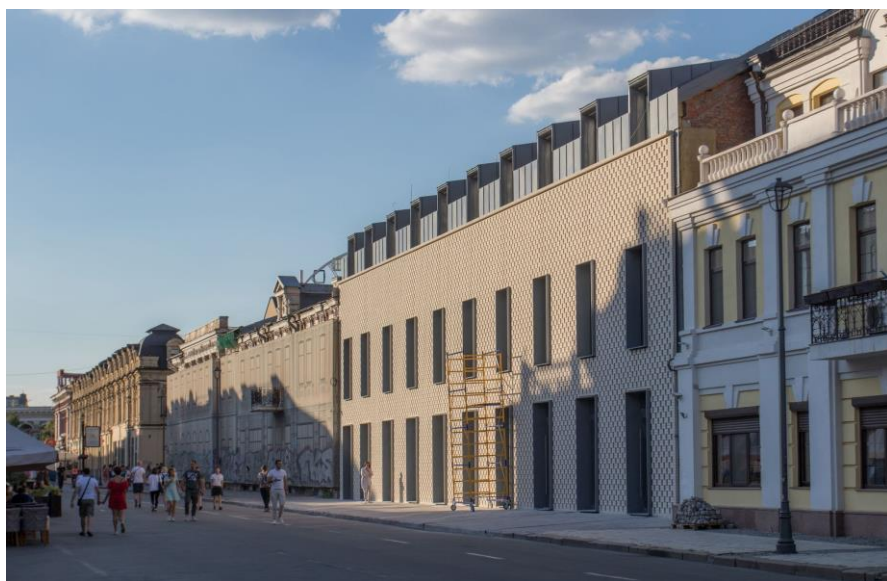
Рис. 8. ЖК SAGA City Space в м. Київ (Україна). Головний фасад.