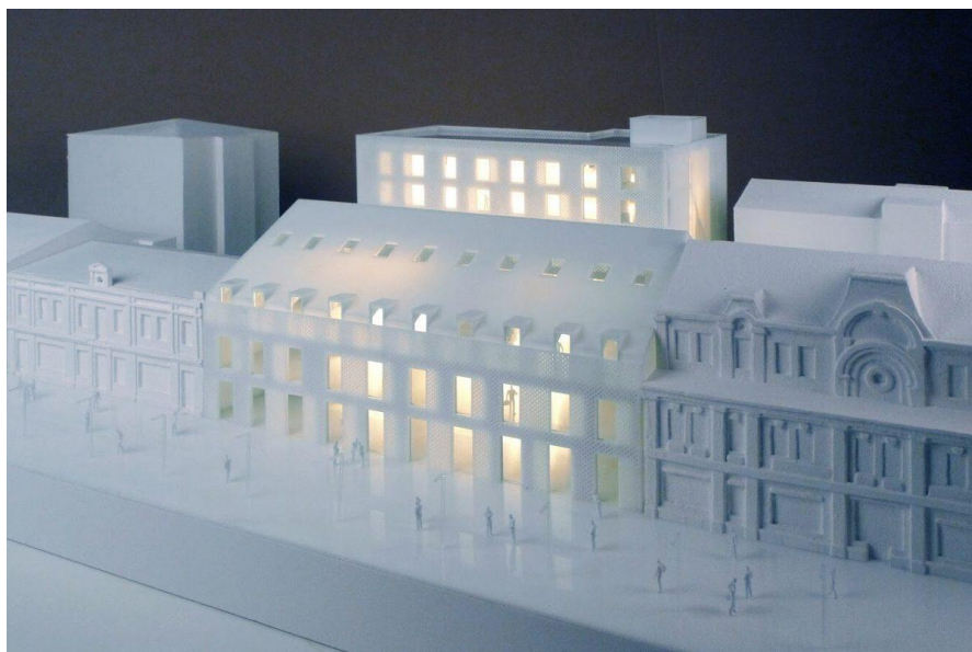
Рис. 7. ЖК SAGA City Space в м. Київ (Україна). Проект.