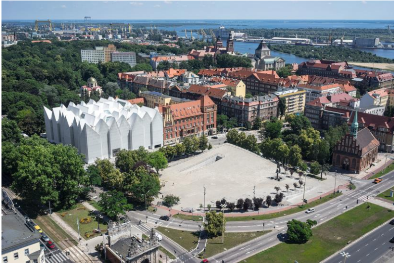
Рис. 12. Будівля філармонії у Щецині (Польща). Загальний вид на міську забудову зверху.