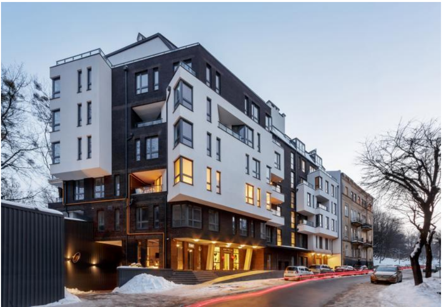
Рис. 14-15. Новий житловий будинок на вул. Зарицьких, 5 у м. Львів (Україна).