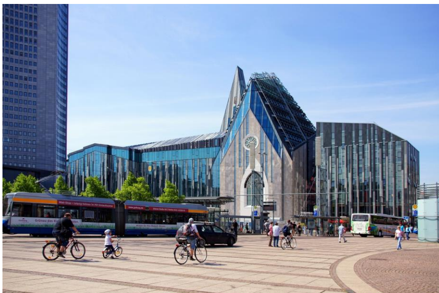
Рис. 11. Новий корпус університету в м. Лейпціг (Німеччина). Головний фасад.