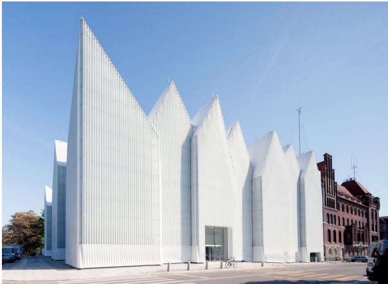
РРис. 13. Будівля філармонії у Щецині (Польща).