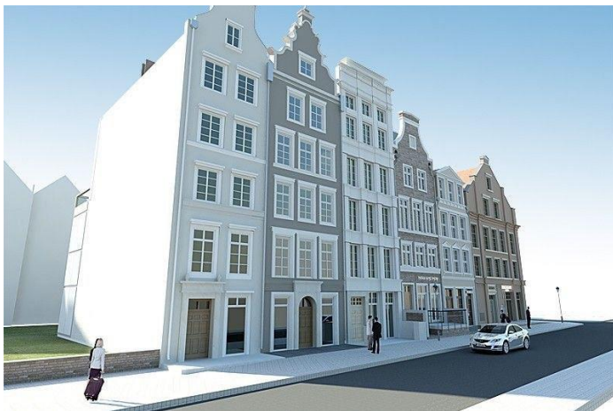
Рис. 1-2. Нова забудова у м. Гданськ (Польща)