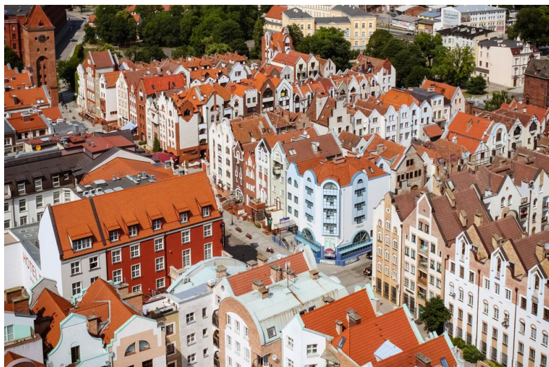
Рис. 5-6. Забудова центральної частини м.Ельблґонґ (Польща),реконструкція 1980-х років