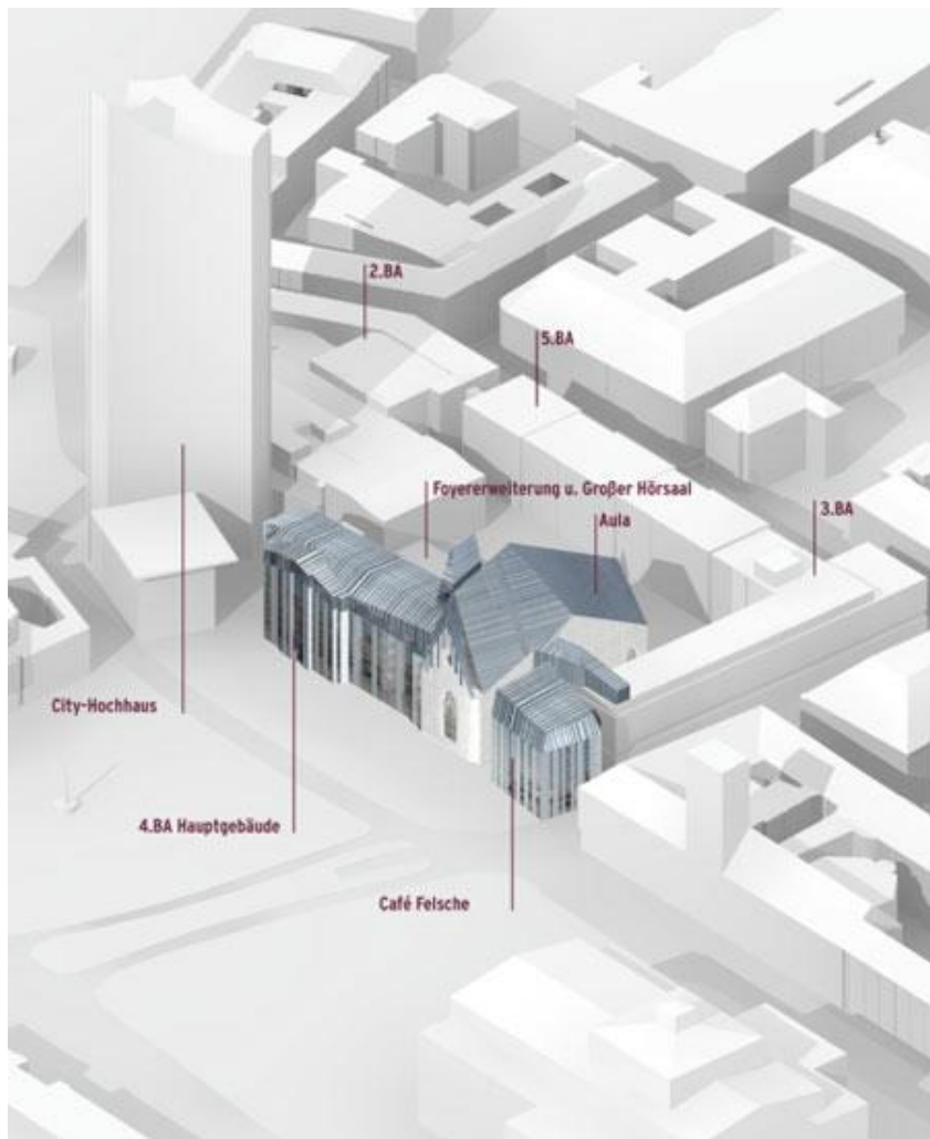
Рис. 9. Новий корпус університету в м. Лейпціг (Німеччина). Концепція розташування. Проект.