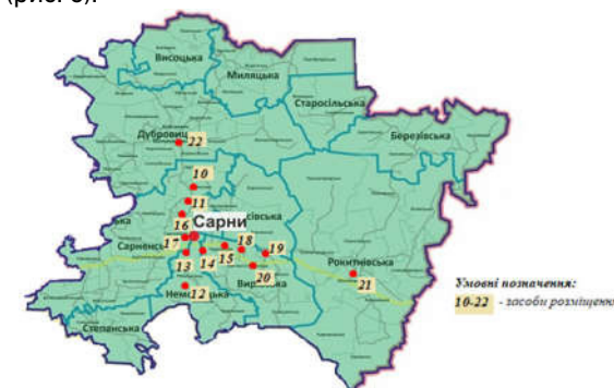
Рис. 3. Розташування КЗР на території Сарненського району (побудовано авторами)