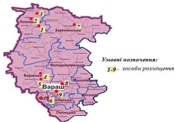
Рис. 2. Розташування КЗР на території Вараського району (побудовано авторами)