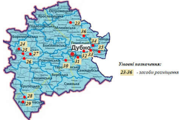
Рис. 4. Розташування КЗР на території Дубенського району (побудовано авторами)

В Дубенському районі 14 колективних засобів розміщення. Більшість засобів розміщення надають інформацію про свої послуги на власній сайтах, у спільнотах популярних соціальних мереж і через відомі системи інтернет-бронювання житла, окрім 5 об'єктів. Зірковість присвоєна двом готелям – «Троянда» і «Фермерська хата» (рис. 4).