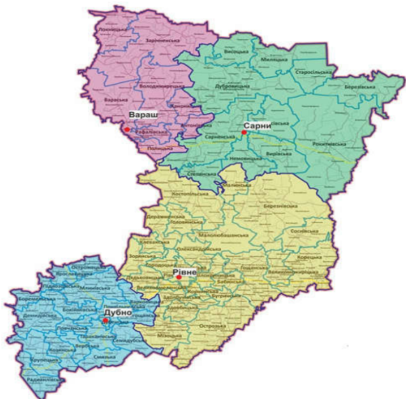
Рис. 1. Адміністративно-територіальний поділ Рівненської області (побудовано авторами на основі джерел [1])

17 липня 2020 року Верховною Радою України було прийнято Постанову № 3650 «Про утворення та ліквідацію районів». Згідно з цим документом, на Рівненщині замість 16 районів утворено 4 (рис. 1).