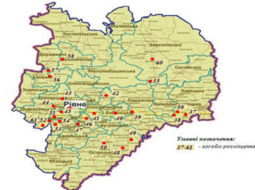
Рис. 5. Розташування КЗР на території Рівненського району (побудовано авторами)

Основна частина колективних засобів розміщення у Рівненському районі зосереджена уздовж автомобільного шляху М 06 міжнародного значення Київ – Чоп (рис. 5).