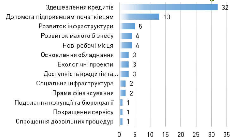
Рис. 3. Пріоритетні напрями фінансової підтримки бізнесу

Загалом 53% відповідей стосуються інструментів фінансової підтримки, які мають у своєму розпорядженні органи місцевої влади. Абсолютним пріоритетом серед інструментів фінансової підтримки є здешевлення кредитів (рис. 3).