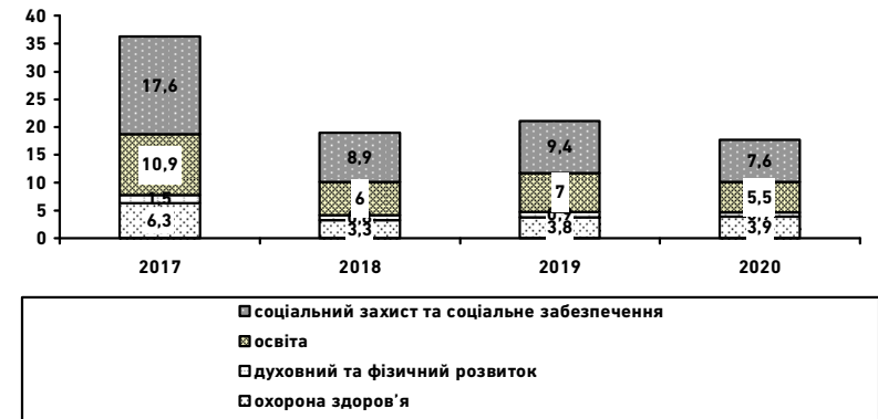
Рис. 3. Показники недофінансування видатків соціального призначення зі зведеного державного бюджету внаслідок податкових втрат від офшоризації економіки, млрд грн

Аналіз показників недофінансування видатків соціального призначення, що зумовлені податковими втратами внаслідок офшоризації економіки, за їх економічною бюджетною класифікацією свідчить (рис. 4), що протягом 2017–2020 рр. можна було б додатково скерувати на оплату праці бюджетників від 9,1 до 46,7 млрд грн, на виплату пенсій і допомог – 23,3 млрд грн, інші соціальні виплати населенню – 19,9 млрд грн.