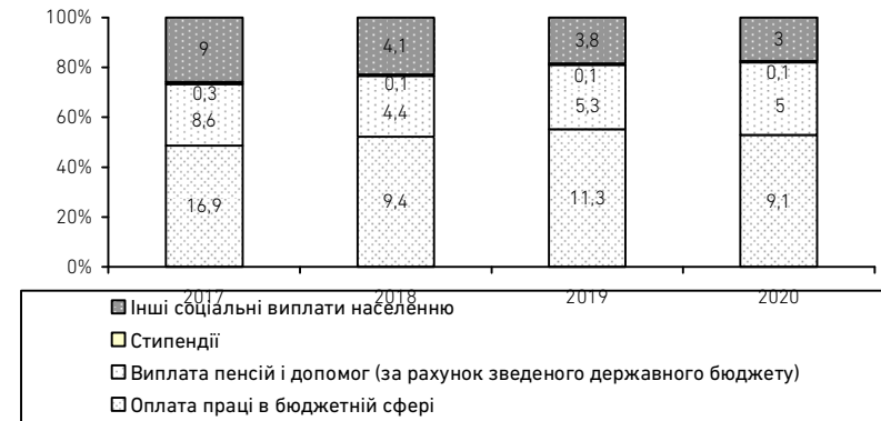
Рис. 4. Показники недофінансування видатків соціального призначення, що зумовлені податковими втратами внаслідок офшоризації економіки, за їх економічною бюджетною класифікацією (млрд грн), 2017–2020 рр.