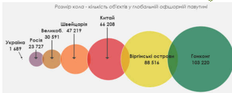
Рис. 1. Місце України в глобальній офшорній мережі Джерело: [2]

Єдиного підходу до обґрунтування податкових втрат від офшоризації національної економіки немає. Проблемами дослідження фіскального ефекту від застосування різних схем ухилення від оподаткування в Україні займаються експерти Інституту соціально-економічної трансформації. За розрахунками експертів вказаного Інституту протягом 2017–2020 рр. фіскальні втрати України від офшоризації національної економіки є досить значимими (табл. 1). При цьому обсяги офшорних операцій та відповідних фіскальних втрат з 2017 р. суттєво зменшились. Так, якщо у 2017 р. податкові втрати від офшоризації становили 50–65 млрд грн, то у 2020 р. – 15–35 млрд грн, що, безумовно, є позитивним.