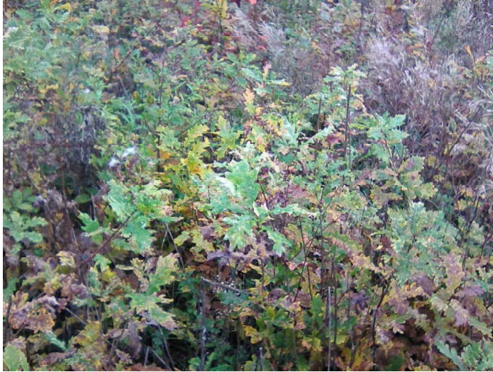
Рисунок. Ділянка з природного поновлення дуба на зрубі в умовах Моївського лісництва ДП «Могилів-Подільське ЛГ»

За показниками табл. 5, природне поновлення дуба звичайного виявлене ділянці зрубу дуба звичайного у свіжій грабовій діброві (рисунок).