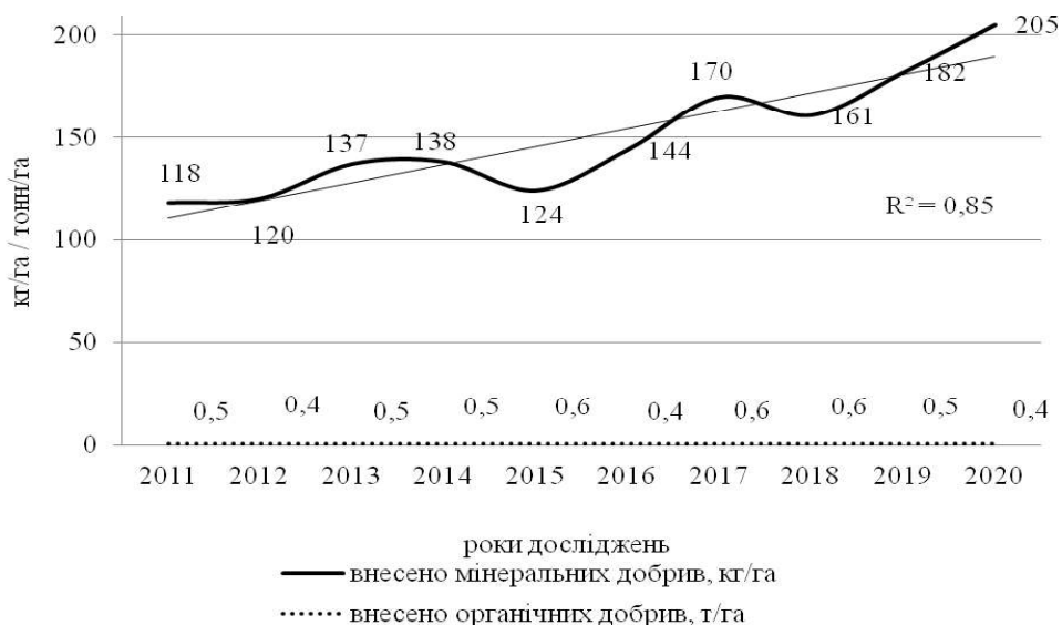
Рис. 2. Внесення мінеральних і органічних добрив під посіви сільськогосподарських культур

Співвідношення частки азотних добрив до фосфорних і калійних постійно зберігається на значеннях близьких як 1,0:0,2:0,2–0,23 з домінуванням у загальній кількості азотних мінеральних добрив масової частки аміачної селітри, як висококонцентрованого, швидкодіючого добрива з двома формами азоту. Для збалансування надходження в рослину та збереження запасів у ґрунті фосфору та калію, необхідно збільшити внесення фосфору у 3–4 рази і калію – у 5–6 разів. Позитивним моментом зростання внесення добрив, зокрема азотних, навіть за не зовсім сприятливого для рослин співвідношення між елементами живлення є те, що компенсується частина азоту, який був використаний мікроорганізмами з ґрунту при розкладі рослинних решток та сидератів без додаткового внесення азоту.