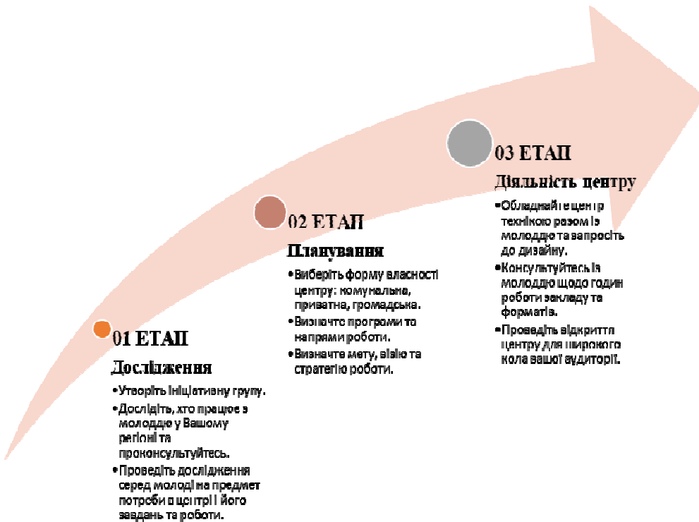
Рис. 2. Етапи створення молодіжного центру

Використання кращих європейських практик розвитку молодіжної політики прискорить створення належних інституційних та економічних умов для самореалізації молоді у громадах. Запропоновано створювати та розвивати молодіжні центри у сільських територіальних громадах, використовуючи досвід Європейського керівного комітету у справах молоді щодо видання знаків якості для молодіжних центрів, адаптувавши його у певну модель добровільної сертифікації таких центрів, що може бути пов'язане їх подальшою ресурсною підтримкою.