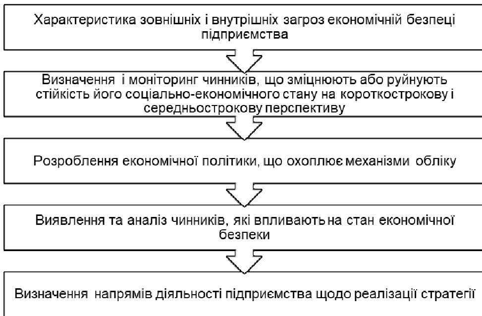
Рис. 2. Формування стратегії управління економічною безпекою