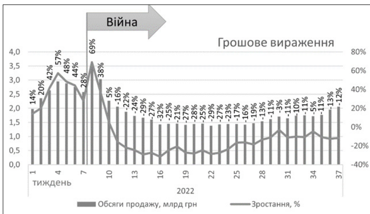
Рис. 1. Динаміка роздрібних продаж, 2022 рік потижнево

Був «класичний» для зимнього сезону гострих респіраторних захворювань розвиток подій (рис. 1) [3].