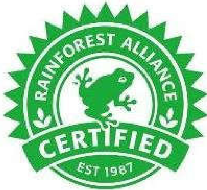
Рис. 2. Маркування сільськогосподарської та деревооброблювальної продукції знаком «Rainforest Alliance»

збереження екосистеми лісу через зменшення вирубування і збільшення насаджень, створенням екологічних зон тощо) (рис. 2).