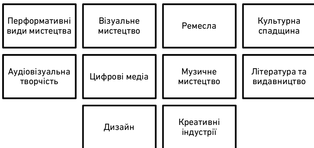
Рис. 1. Галузі сфери культури

Для того, щоб зрозуміти природу культурних проектів необхідно насамперед знати, які сектори входять у сферу культурних індустрій. Нині немає загальноприйнятої класифікації галузей сфери культури, проте на основі проведеного огляду різних підходів можна виокремити наступні сектори (рис. 1):