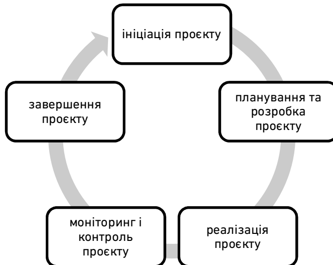
Рис. 2. Життєвий цикл культурного проєкту

Ініціація проєкту (тобто старт проєкту). Процес ініціювання визначає зміст та межі проєкту. Якщо зазначений етап виконується не повною мірою, то здебільшого проєкт не буде життєздатним. На етапі ініціації прописується концепція проєкту, яка включає наступні аспекти: