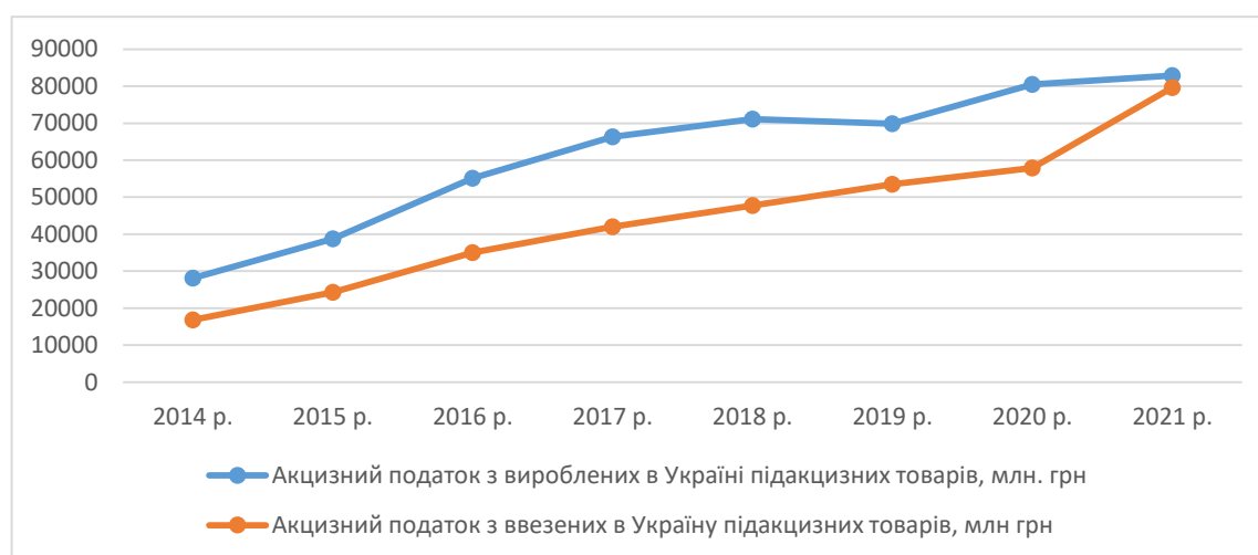
Рис. 2. Динаміка надходжень акцизного податку з вироблених в Україні підакцизних товарів та ввезених в Україну підакцизних товарів за 2014-2021рр.

Для більш детального дослідження динаміки надходжень доцільно розглянути рис.2.