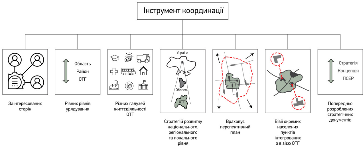
Рис. 1. Координуюча функція інтегрованого просторового планування [2]

особливості громади, а також дозволяє скласти якісні технічні завдання на проєктування територій. Якісна реалізація концепції дозволить досягти згоди щодо бачення розвитку території між зацікавленими особами та різними рівнями врядування – місцевим, районним, обласним [2].